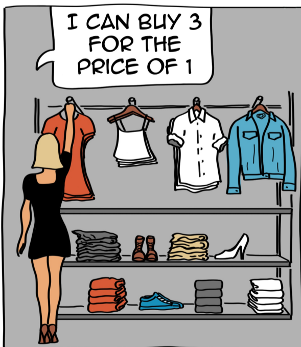
- Puc comprar-ne 3 pel preu d'1

Una onada denunciada a Washington pel seu gran impacte en el medi ambient, en la indústria i fins i tot en la seguretat nacional nord-americana que ha acabat per moure la dreta. Això mateix passa a París on els diputats d'Horizons (grup de dreta nascut el 2022) ha presentat aquest mes de març un projecte de llei per prohibir la publicitat i penalitzar les plataformes de "moda d'un sol ús" com Shein i Temu. En definitiva, per ara un intent de regular una indústria fora de control.