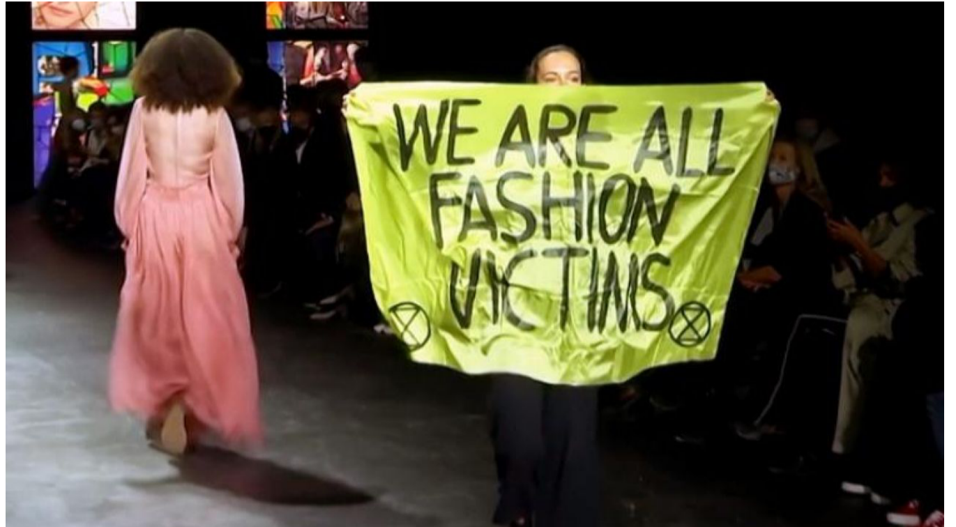
TOTS SOM VÍCTIMES DE LA FASHON