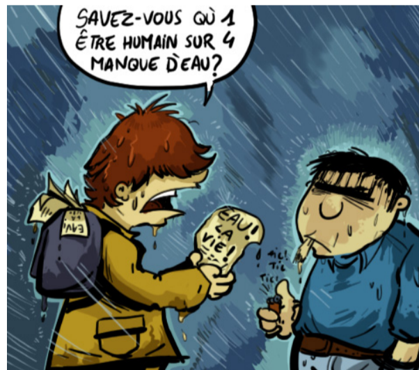
- Sap que 1 ser humà de cada 4 manca d'aigua?

d'aigua en temps de sequera apel·laven a la manca de pressupost per endegar l'obra faraònica que suposava taponar la canalització afectada. Fins que un dia, un paleta i el seu aprenen, tips de no poder dutxar-se després de la feina diària, van anar un diumenge al lloc de la fuga. Van agafar una mica de ciment i alguns draps vells de cuina i en mitja hora Badalona recuperava milions de litres d'aigua.