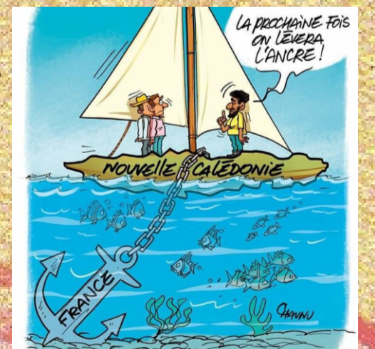
- La propera vegada llevarem l'àncora!