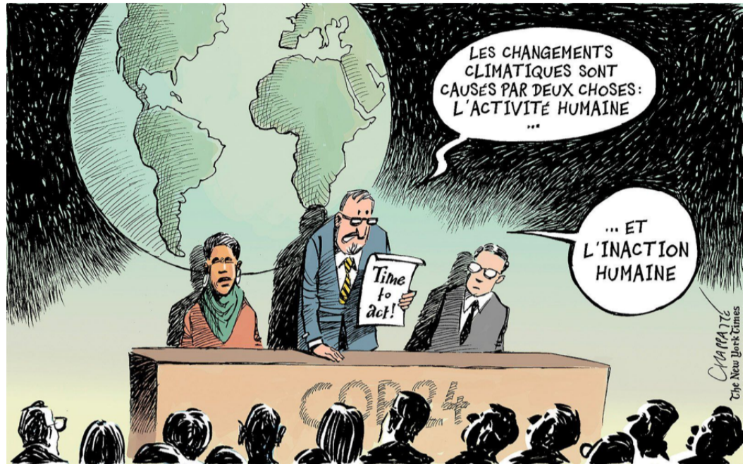
ÉS EL MOMENT D'ACTUAR! - El canvi climàtic està causat per dues coses: l'activitat humana... - ... i l'inacció humana