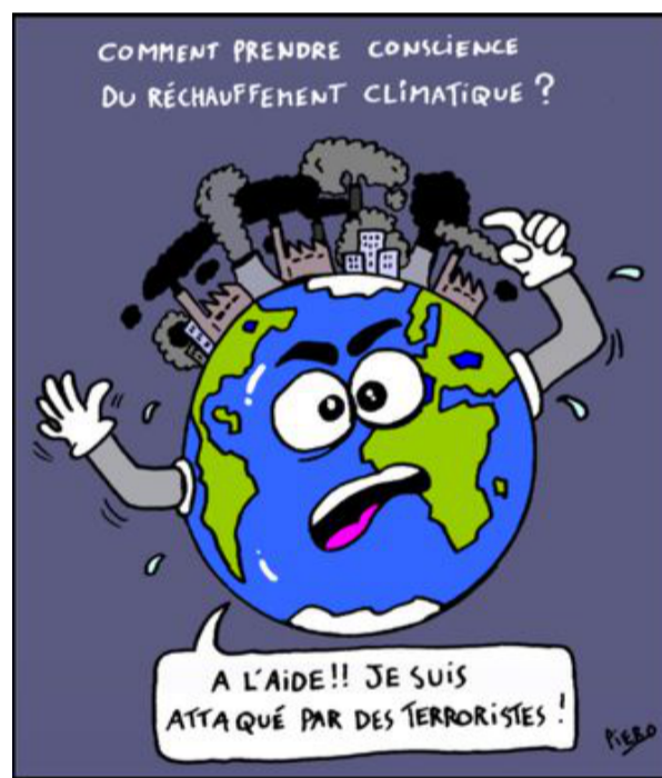
COM CONSCIENCIAR SOBRE L'ESCALFAMENT DEGUT AL CANVI CLIMÀTIC? - Ajuda!! M'ataquen terroristes!