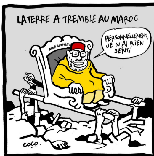
LA TERRA TREMOLA AL MARROC

En tot cas i perquè no es digui que ens neguem a obsequiar als nostres reis, vagi per endavant una LLUFA ben guarnida pels monarques esmentats.