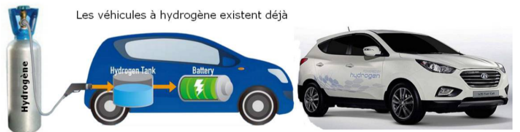
Les véhicules à hydrogène existent déjà

Fins que els tècnics aconseguixin encarir-lo altra vegada i torni a ser dolent.