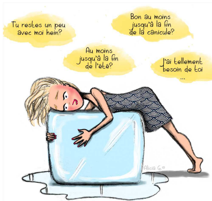
Et quedes una mica amb mi, eh? Fins al final de l'estiu? Et necessito tant...

Sovint ens exclamem de les morts que provoca una guerra, una revolució, una dictadura, un holocaust. Crims que ha provocat un govern, un exèrcit, com a molt tot un país. Els que ara estem matant a Gaia som tots nosaltres... però no ens queixem gaire, només quan no ens deixen omplir la piscina.