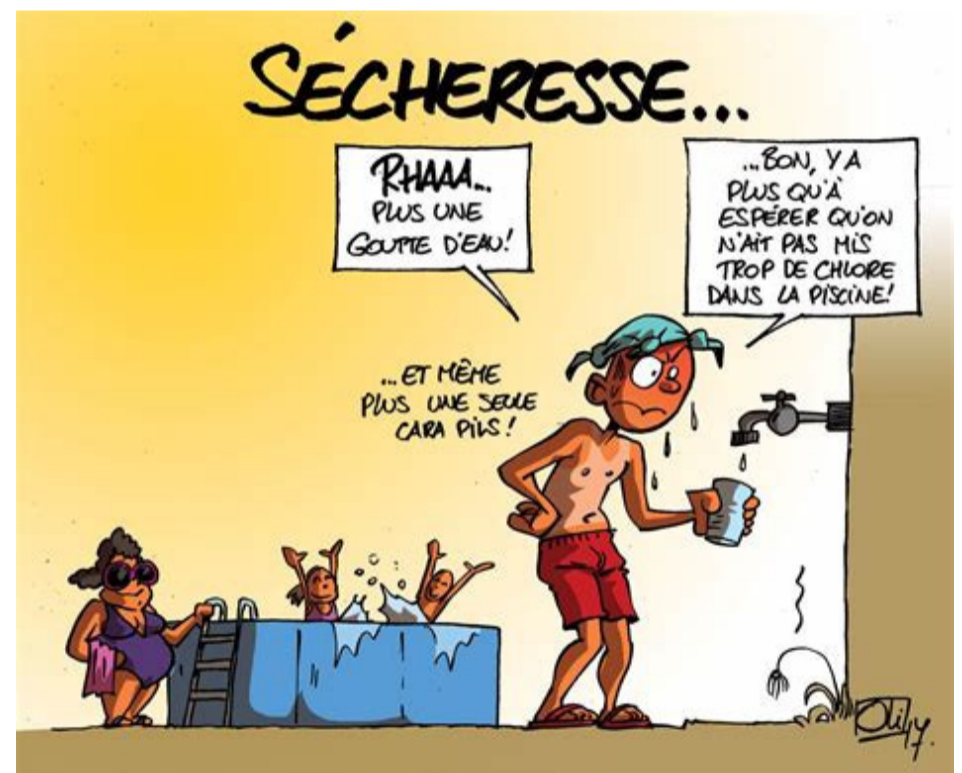
SEQUERA... - Ah! Ni una gota d'aigua! - ... bé, esperem no haver posat massa clor a la piscina!