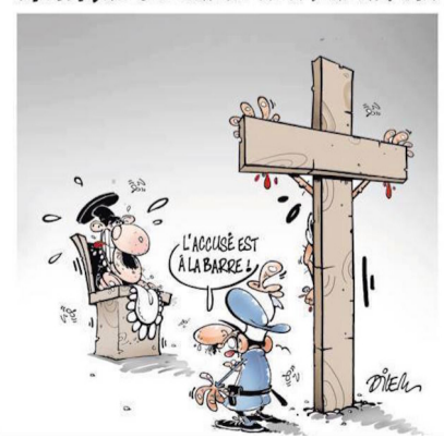
UN ALTRE PROCÉS PER "PRACTICA DEL CULTE NO MUSULMÀ" - L'acusat és a l'estrada!