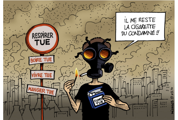
Respirar Mata - Beure Mata - Viure Mata - Menjar Mata - Em queda el cigarro del condemnat!!