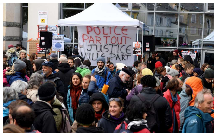
POLICIA A TOT ARREU JUSTICIA ENLLOC