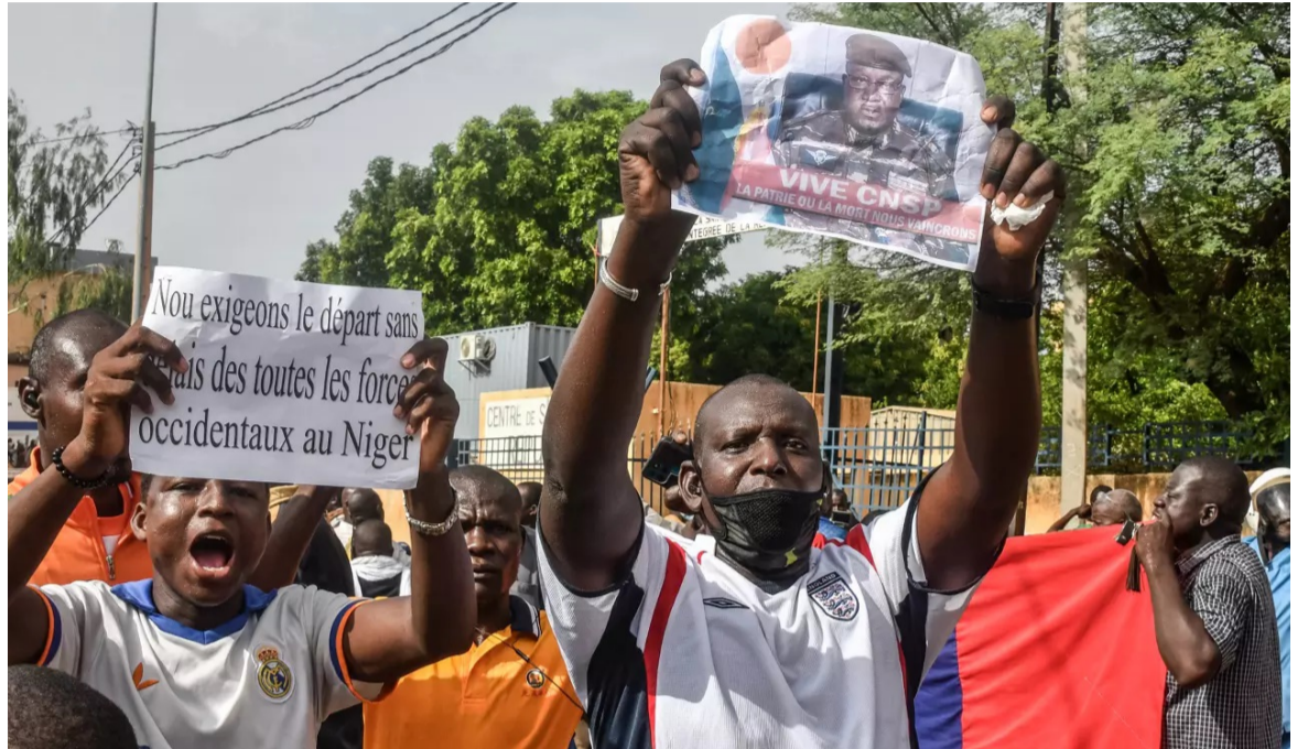
Exigim la sortida immediata de totes les forces occidentals de Níger.

Després de Mali i Burkina Faso, Níger, fins ara aliat amb països occidentals, es converteix en el tercer país del Sahel, soscat pels atacs de grups vinculats a l'Estat Islàmic i Al-Qaida. Però per altra banda, Níger és actualment el pivot del sistema antigihadista francès al Sahel, des de l'expulsió de l'exèrcit francès de Mali l'estiu del 2022, amb 1.500 soldats francesos sobre el terreny.