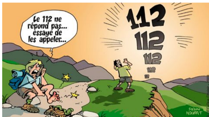
El 112 no respon... intenta contactar-los...