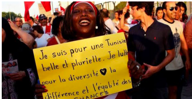
Vull una Tunísia bonica i plural. Lluito per la diversitat, la diferència i la igualtat de possibilitats.

A vegades és més fàcil ser víctima que dominador. Com a víctima sempre tens