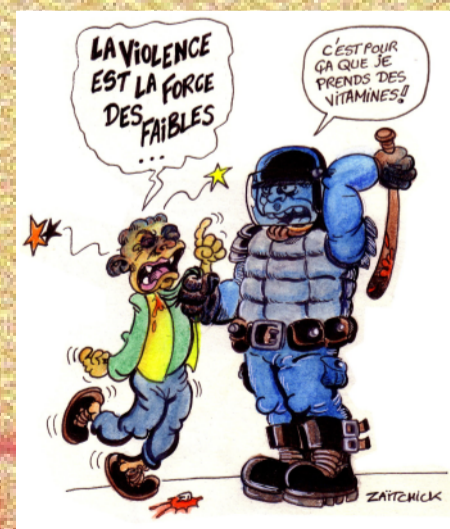
- La violència és la força dels febles... - És per això que prenc vitamines!!

Hem acompanyat al ministre que amb un paper rebregat i un llapis va posant creuetes. Una per cada els 12.202 incendis de contenidors d'escombraries, 5.892 incendis de cotxes i 1.105 edificis cremats o danyats. Hem escoltat el cap de la patronal, Geoffroy Roux de Bézieux, que diu estimar en mil milions d'euros els danys per a les empreses. Hem tremolat quan ens han parlat de la multiplicació d'atacs a les comissaries de policia nacional i municipal i les gendarmeria. 269 han estat atacades. Després hem anat a casa i ens hem fotut un martini. No hi ha res com ser de dretes per parlar de diners i evitar parlar d'assassinats i violències policials i altres collonades.