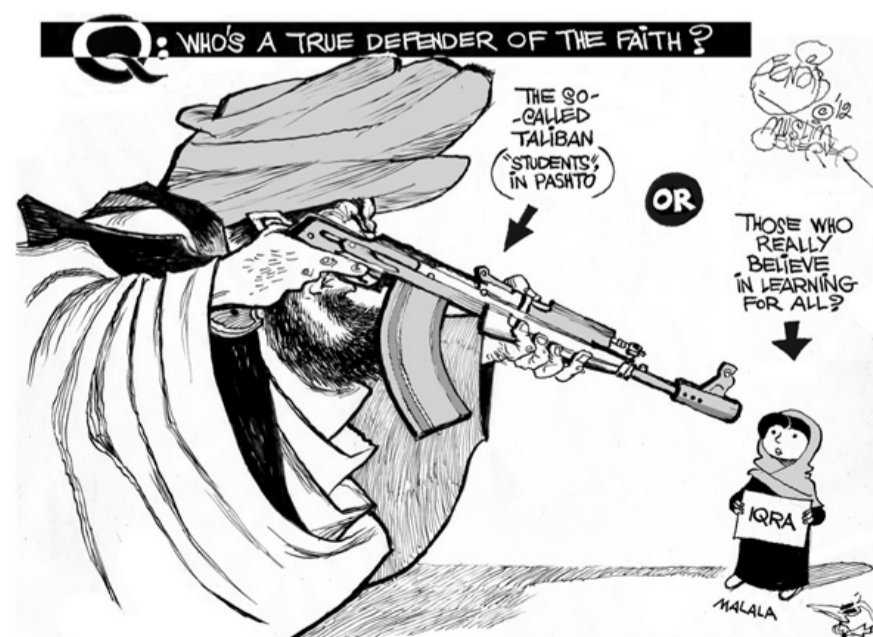
QUI ÉS EL VERITABLE DEFENSOR DE LA FE? - Els que els talibans anomenen "estudiants", en paixtu. - Els que realment estudien de veritat?

Malgrat l'ambient de terror que respiren les dones, moltes d'elles