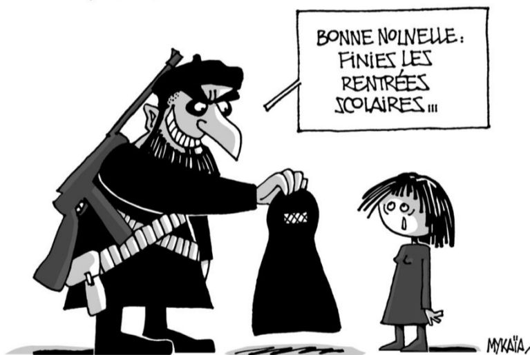
AFGHANISTAN: EL RETORN DELS TALIBANS - Bona nova: s'han acabat la reentrada...