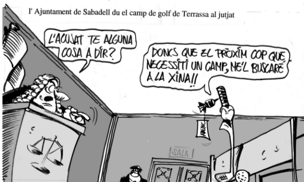
l'Ajuntament de Sabadell du el camp de golf de Terrassa al jutjat

Una cosa és el capitalisme i una altra la ecologia. A vegades, moltes vegades, van lligats, cert, però no es combaten