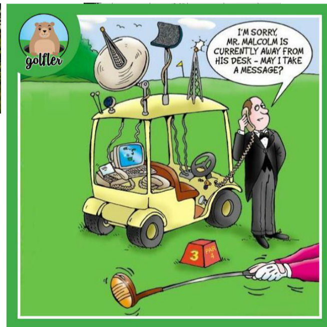
- Disculpi, M Malcom està fora del seu despatx - em vol deixar un missatge?

telefonar. Havia menjat verdura, un bistec i després molta fruita. Es sentia estupenda que és probablement com s'han sentit aquests revolucionaris ecològics.