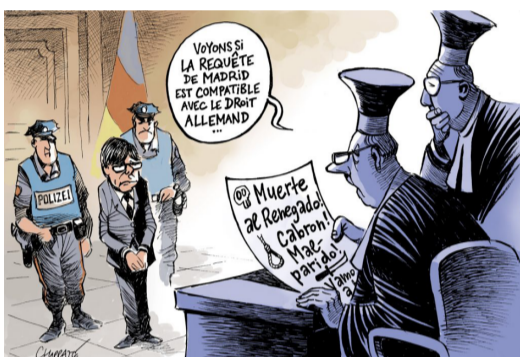
- Mirem si la demanda de Madrid és compatible amb el dret alemany...