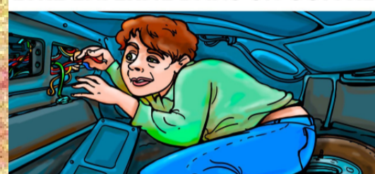
ESTAR TANCAT AL PORTAEQUIPATGE