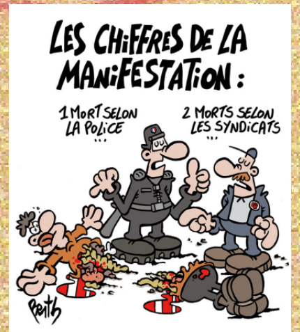
LES XIFRES DE LA MANIFESTACIÓ 1 mort segons la policia... 2 morts segons els sindicats...

Dos manifestants entre la vida i la mort, molts ferits greus a la cara, un dels quals s'ha quedat borni, desenes de ferits amb greus cremades... La manifestació prohibida del 25 de març, en oposició al projecte de construcció d'una megabassa a Sainte-Soline (Deux-Sèvres), ha estat marcada per una violència poc vista en els últims anys a França. Davant de centenars d'activistes organitzats i equipats per enfrontar-se a la policia, però també a milers d'altres, pacífics, l'Estat no va dubtar a desplegar més de 2.000 gendarmes mòbils. Les ordres? Recórrer a l'ús massiu de les anomenades armes intermèdies però capaces de matar... En poques hores, van disparar més de 5.000 granades de gasos lacrimògens però també milers de granades GM2L, que contenen una perillosa càrrega pirotècnica.