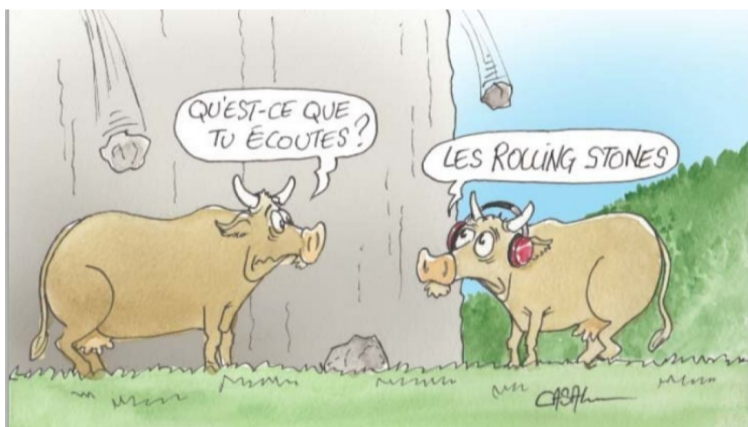
- Què escoltes? - Els Rolling Stones