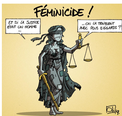
Si la justícia fos un home se la tractaria amb més consideració?

diàriament. No hi haurà cap avenç cap una transformació social igualitària i cap a un món de dones i homes lliures si no arribem a una igualtat social total i de respecte entre els homes i les dones.