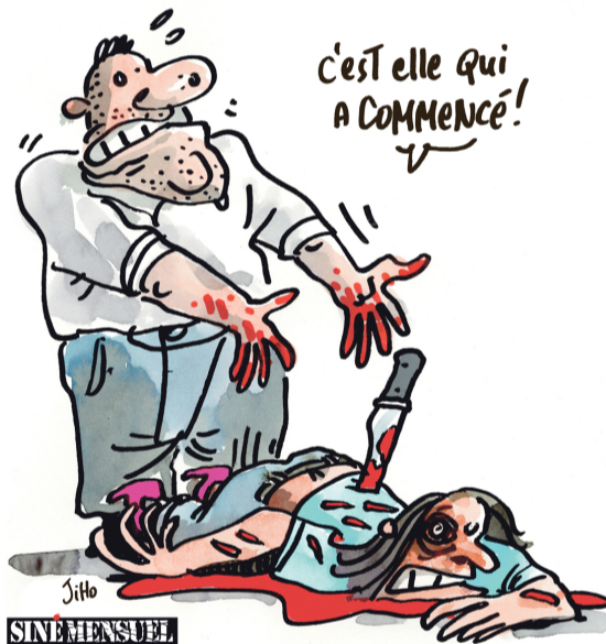
Ha començat ella!