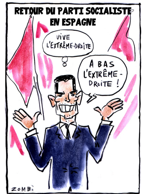
RETORN DEL PARTIT SOCIALISTA A ESPANYA -Visca l'extrema-dreta -A baix l'extrema-dreta!