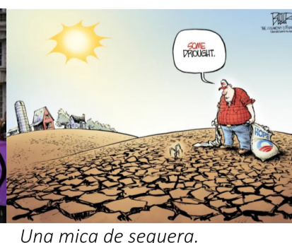
Una mica de sequera. ESPERANÇA