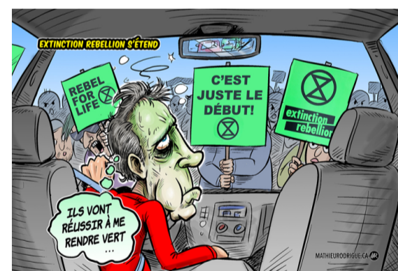
Rebel a vida. Només és el començament! Extinció rebel·lió. -"Han aconseguit tornar-me verd..."

Per protegir el món viu, cal l'adopció d'un reglament europeu per posar fi a la desforestació importada, garantir que l'agricultura i la ramaderia industrials deixin d'enverinar aigua, aire i terra amb els seus pesticides i altres fertilitzants químics, cal fer campanya per la protecció integral d'almenys el 30% dels oceans en el marc d'un tractat internacional d'alta mar.