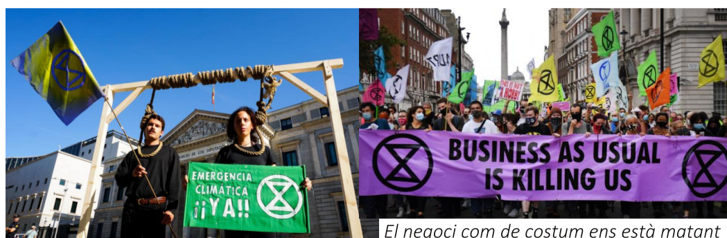
El negoci com de costum ens està matant

Però passeu l'estiu tranquils! La calor extrema, els mosquits, la manca de pluja, els incendis només són la "demo" del que ens espera.