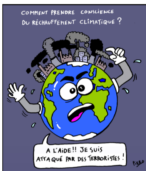
Com prendre consciència de l'escalfament planetari? Ajudeu-me!! m'ataquen terroristes!!!